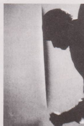
Lucio Fontana erstellt ein »Concetto spaziale« (Raumkonzept), Mailand 1965.