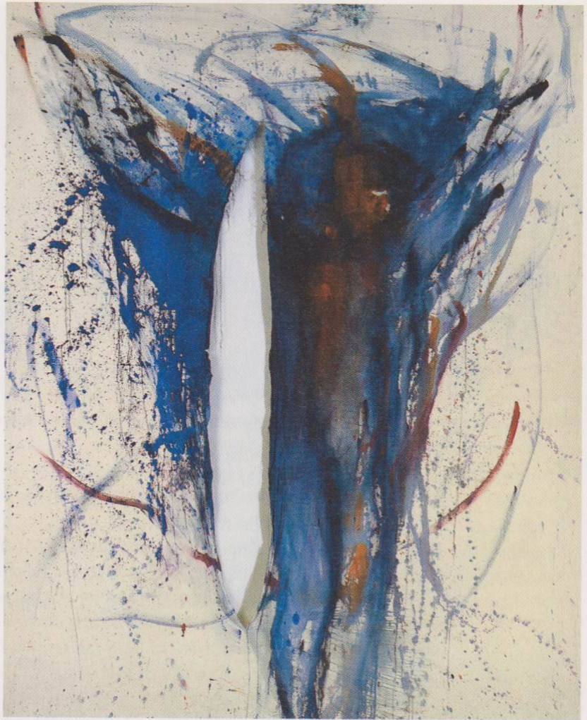
Barbara Heinisch: Ostern II, 1980. Tempera auf Nessel, 210 x 165 cm. Pax-Christi-Kirche, Krefeld.

Das »Modell« bewegt sich hinter einer Nesselwand, die Künstlerin bannt konturenhaft wesentliche Momente des tänzerischen Bewegungsablaufes. Beiderseits ein intuitives Agieren, bzw. Re-Agieren, das die besondere Dichte der Aktion (und des späteren Bildes) ausmacht. Kein Gegen-Einander, sondern ein Mit-Einander. Prägnantes Beispiel für dieses innovative Vorgehen ist die Arbeit »Ostern«, Resultat einer Performance mit dem Sänger Mark Eins im Berliner Künstlerhaus Bethanien. ... Links im Bild ein Riss: Spur eines »Aussteigens« aus dem Werk nach der Malaktion. Diese »Verletzung« besitzt ambivalente Züge, da sich das Modell beim Heraustreten einen Augenblick mit dem Bild vereint, sich aber gleichzeitig von ihm befreit ... Hanna Humeltenberg